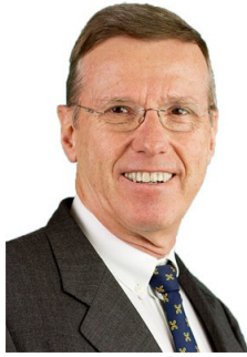
Wolfgang Ulf Wayand Distrikt Governor 1920 – RC Linz-Süd