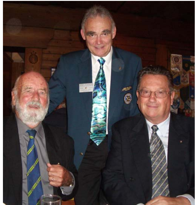
Vom Besuch beim RC Schärding - mit starkem PR Wert, dem RC Zillertal