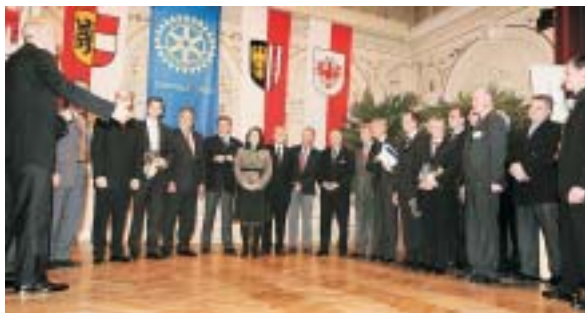
Neue Mitglieder, Gruppenbild mit Dame und Präsidenten.

Der RI Präsident wird im Laufe seines Jahres 90 solcher Intercitymeetings besuchen, vor Linz war er in Heidelberg und in St.Gallen, nach Linz